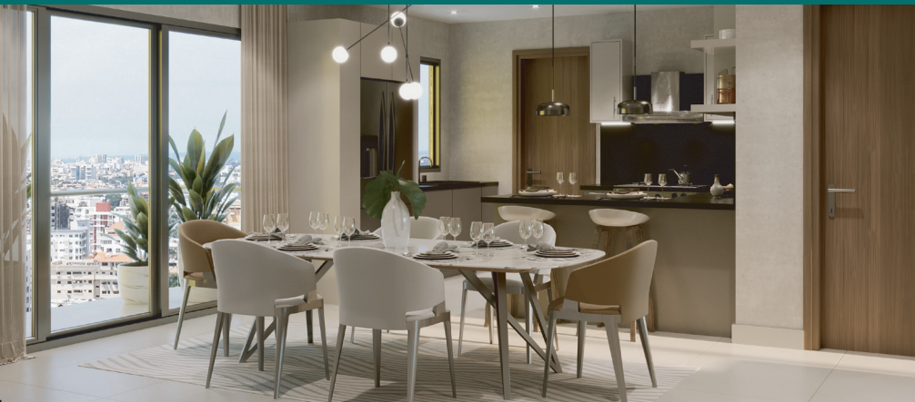
APTO A - COMEDOR - COCINA