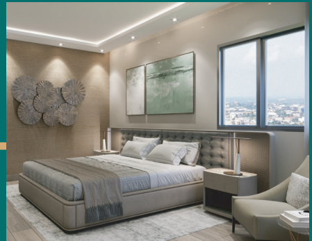
APTO A - HABITACIÓN

Diseños prácticos y contemporáneos; espacios cómodos e integrados con excelente terminación, donde podrás disfrutar en familia tiempos íntimos en el hogar.