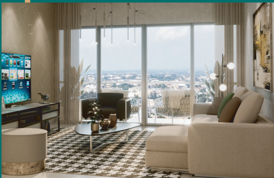
APTO A - SALA